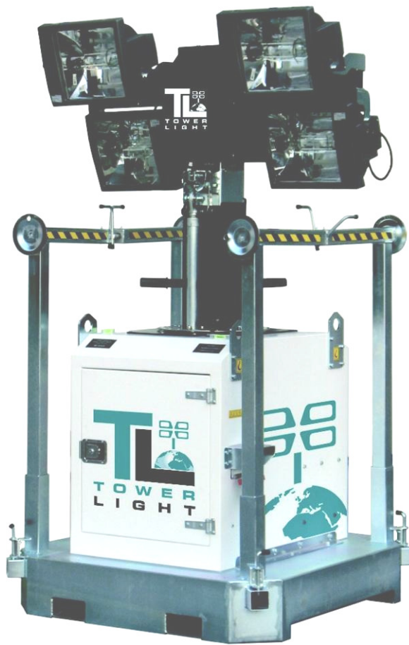
4x1000W MH 8m = 3800sqm – 20 Lux average illuminated area